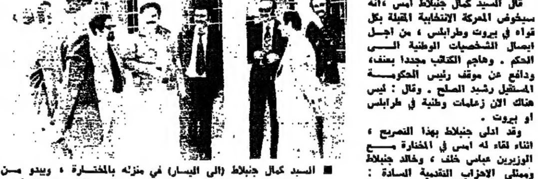
السيد كمال جنبلاط (الي اليسار) في منزله بالمختارة - ويبدو من اليمين: نجله وايد والسادة: محسن ابراهيم، عباس خلفه جورج حاوي، توفيق سلطان